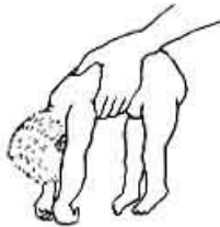
Trẻ bại não