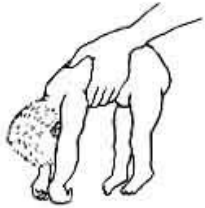
Trẻ bại não