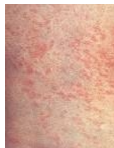
Ban do Rubella

Nếu bị bệnh có sốt kèm phát ban nên đi khám bác sĩ chuyên khoa ngay nhất là khi xảy ra khi mang thai trong ba tháng đầu của thai kỳ.